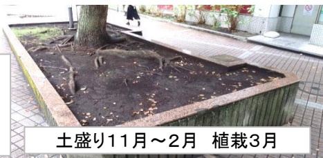
土盛り11月～2月 植栽3月