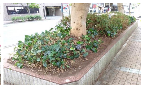
東口ヤマモモ植栽柵③剪定完了