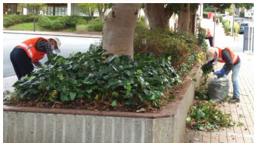
東口ヤマモモ植栽柵作業風景