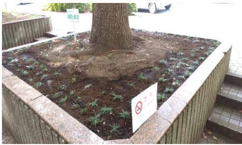
西口「B」植栽柵龍ひげ植え込み完了