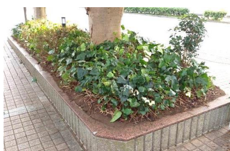
東口ヤマモモ植栽柵②剪定完了