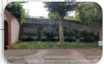
④サン・ステージ西の街緑化 四季の径トンネル手前裸地改善