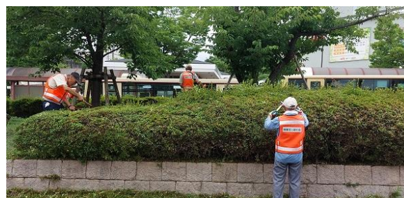
東口ロータリーの剪定作業

新たに駅東口ロータリーにおける作業拡大に取り組みました。ロータリーの中心部には河津桜とつつじの植栽があります。これまでは「チガヤ」の雑草が生い茂り、特に夏場は見栄えが悪い状況にありましたが、5月から毎月除草・剪定作業を行い維持に努めています。