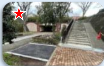
RCA/泉土木協業:歩道新設