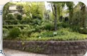
③サン・ステージ西の街緑化 管理センター横緑化