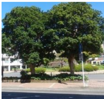
駅東口のヤマモモ

当会では毎月の共同作業の他に、日頃の水やりや駅周辺の落ち葉清掃作業を週2～3回行っております。西口のクスノキや東口のヤマモモが高木となり、年中落葉の清掃が欠かせない状況です。また、東口のヤマモモは鳥の糞害に悩まされています。これらの状況の改善のために、相模鉄道様へ高木の剪定を依頼中です。