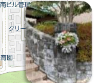
②ハンギングバスケット 講習会の実施 作品の活用