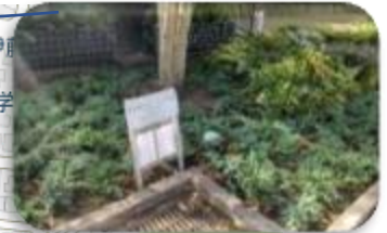
④サン・ステージ西の街緑化 四季の径トンネル手前