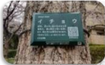
四季の径一帯の 樹木銘板設置 今年度 40カ所設置