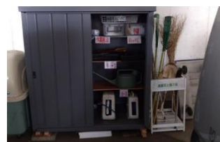
作業道具保管場所改善状況

当会では相模鉄道様のご了解をいただき、緑園都市駅の高架下に日頃の作業に使用する「ほうき・水やりホース・ジョウロや各種道具」を保管しています。整理整頓及び作業性アップのため、7月に新しく物置等を設置しました。