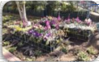
④サン・ステージ西の街緑化 四季の径トンネル手前