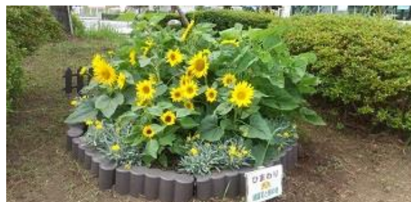
ヒマワリの開花状況

駅東口ロータリー内の植栽部分の一部に相模鉄道様のご了解をいただき、花壇を造成しました。駅出口正面側に花植えを行い、駅前を明るくします。今年は「ひまわり」が見事に咲きました。