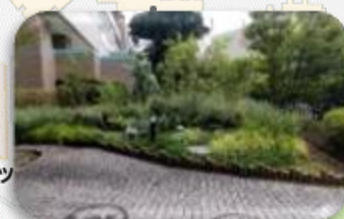
①サン・ステージ西の街緑化 セントラルスポーツ横