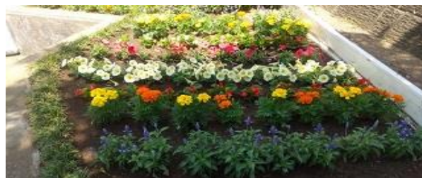
クラブハウスの花壇

緑園地区の公共場所の花壇管理を支援しています。四季の径遊歩道2ヶ所・自治会館・クラブハウスに花壇があり、緑友会等が管理をしています。RCAでは春・秋の花の頒布会時に花苗を無償提供して協力しています。駅周辺の花壇・プランターは当会が管理しています。