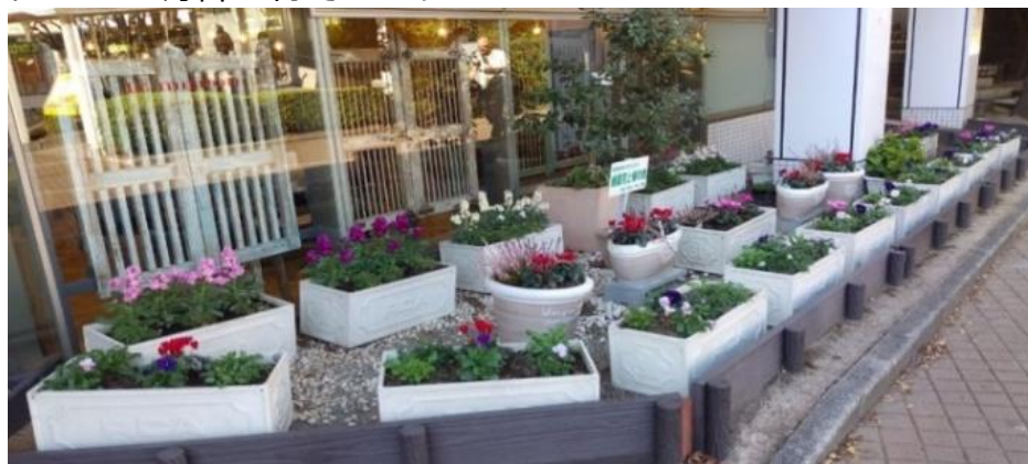
活動のシンボル：緑園都市駅東口花壇

「緑園花と緑の会」の活動のシンボルとして駅東口・西口の空き地に、相模鉄道様の協力を頂き花壇を造成しています。春と秋の2回植え替えを行い駅前活性化に取り組んでおり、地域の皆さまから好評を得ています。