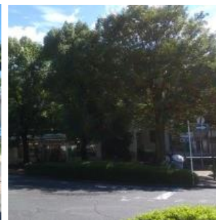
駅西口のクスノキ