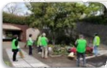
ハマロードサポータ 四季の径 冬・並木との協業