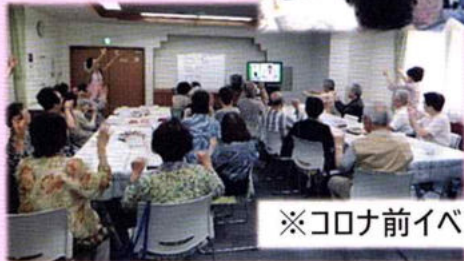
※コロナ前イベント