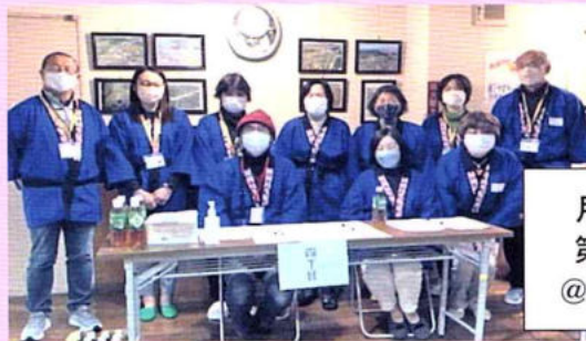
月次定例会 第3日曜日 @交流センター