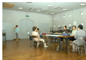
グリーンメイト (ダンス)