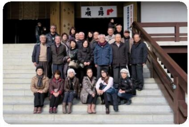
成田山新勝寺本堂で初詣後に記念撮影