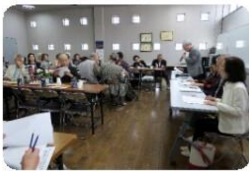
総会の熱心な審議風景