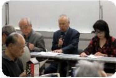
豊倉氏の適切な議長進行で順調な議案審議