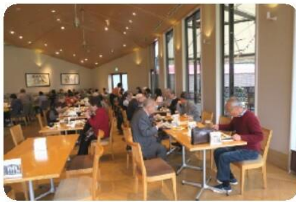
初詣前にメニュー豊富なバイキングの昼食(ホテル日航成田にて)

一月十九日 恒例の成田山初詣。参加者 緑友会一七名、東花会六名。旅程：緑園(八時三十分)→ホテル日航成田(十一時二十分)→十二時三十分→成田山新勝寺(十二時五十分)→十三時五十分→千葉県・濃溝の滝(十五時二十分)→十五時五十分→緑園(十八時)で天候にも恵まれ楽しい旅行が出来ました。