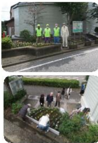
十一月三十日(清掃)