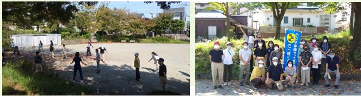
②緑園2丁目:東田谷公園ラジオ体操

<策定> 緑園地区社会福祉協議会 電話：090-3426-0294 <事務局：緑園地区地域支援チーム> 泉区福祉保健センター 電話：800-2401 泉区社会福祉協議会 電話：802-2150 新橋地域ケアプラザ 電話：813-3877