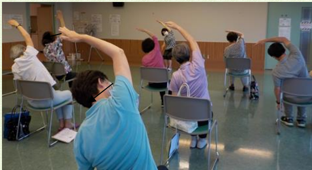
新橋ケアプラザ:ラジオ体操講習会参加