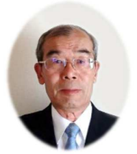
緑園地区社会福祉協議会

日頃は、緑園地区社会福祉協議会(以下緑園地区社協)の諸活動にご理解ご協力を賜り厚く御礼申し上げます。