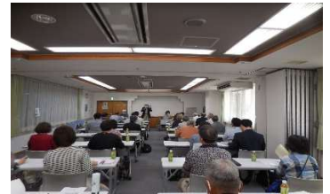
↑議案説明 ~ 採決↓