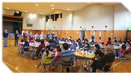
おやつ時間・ハーモニカ演奏