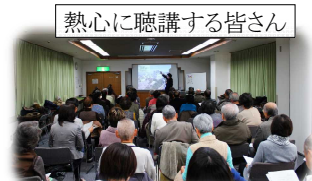
熱心に聴講する皆さん