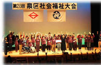
「ぶどうの樹」の発表

緑園地区社協定期総会：H27年5月17日(日) 15時～ (於)緑園地域交流センター