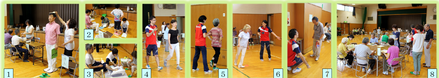
写真: [1]身長・血圧 [2]体組成 [3]骨密度 [4]5m歩行 [5]開眼片足立ち [6]TU&G [7]握力 [8]結果の見方説明

(*1)測定:保健活動推進員 (*2)測定:スポーツ施設関連会社の専門家 (*3)説明:(*2)の専門家と区保健師