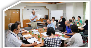
ご意見はまとめて提案!