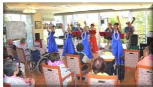
バンド(アロハサウンズ) と フラ(アロハサークル)の共演