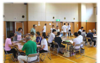
結果の見方・情報紹介