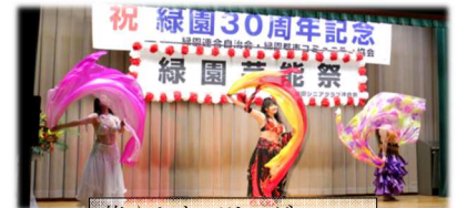
華やかなベリーダンス!!

去る11月26日(日)第3回緑園芸能祭が緑園地域交流センターで開催された。緑園シニアクラブ連合会の主催とあり当地区の高齢者を中心に近隣の方々も参加、出演者108人・組、友人や応援者を含めると200人以上と大いに賑わい、正に当社協が推奨している人と人との「つながり」でもあった。一方、歌の先生やプロ歌手も加わり会場は満足感に溢れ、緑園地区社協のスローガンである「人と和のある緑園」に相応しい有意義な芸能祭となった。(寄稿:緑園地区社協顧問 後藤登美雄氏)