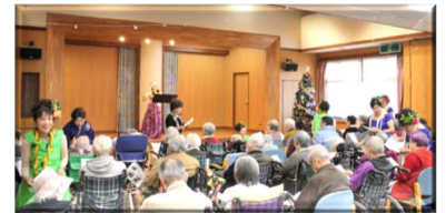
懐かしのメロディ