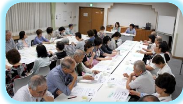
在宅介護を知ろう！