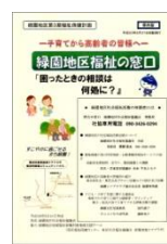
福祉の窓口はここ!