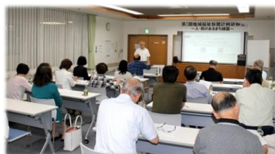
フェイスブックの活用