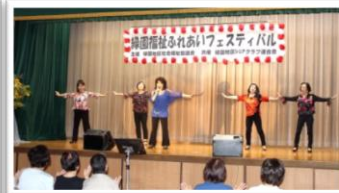
歌とダンスの熱演