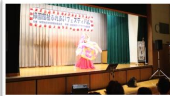
華麗なベリーダンス