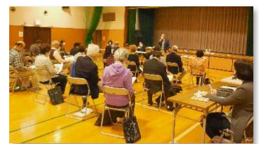
↑議案説明 ～ 採決↓

5月13日(金)緑園地域交流センターにおいて、令和元年以来2年振りに緑園地区社会福祉協議会の定期総会は2年ぶりに対面方式で開催された。当日は、雨まじりの生憎の天気だったが、29名が参加し委任状9通と併せて38票で、総会は問題なく成立した。コロナ禍でもあり今年度新規役員候補2名の自己紹介に止めた後、直ちに令和3年度事業報告及び決算・監査報告、令和4年度事業計画、予算、役員選出の各議案が付議され、何れも承認された。その後、一般質疑、区社協幹部並びに区役所支援チームの紹介が行われた後、閉会となりました。